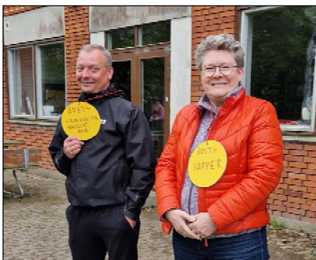
Årets frækkeste Brilleabe samt Årets Yapper