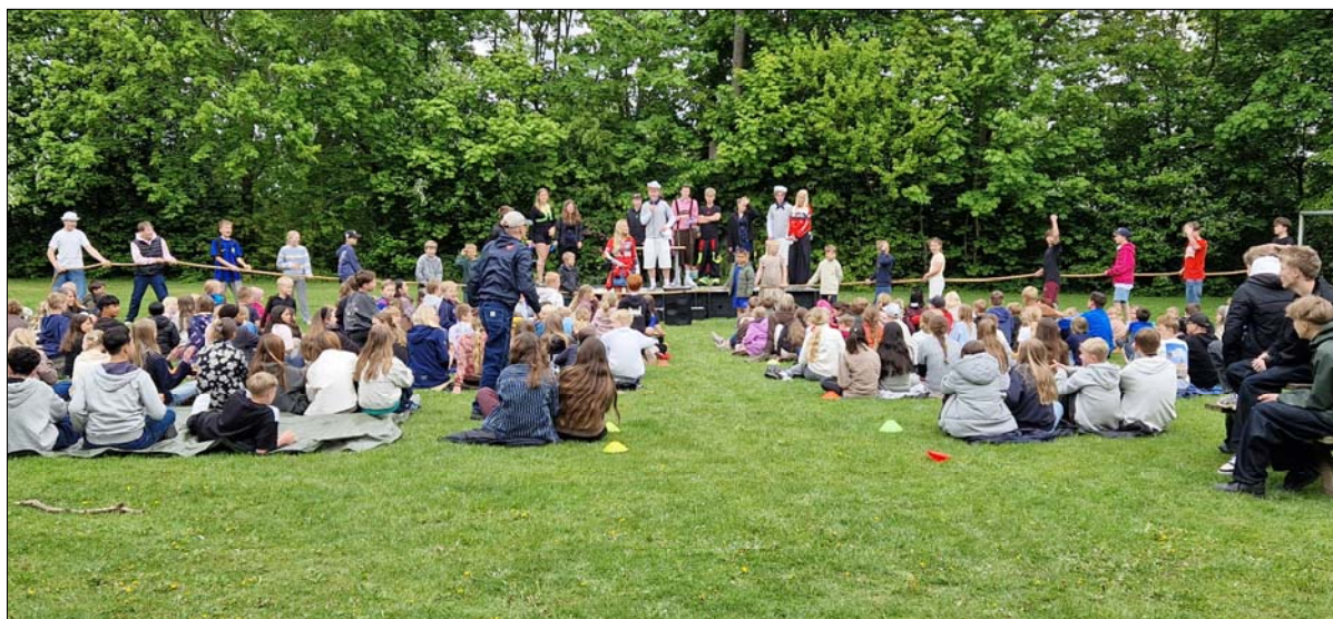
Der blev også afholdt tovtrækning