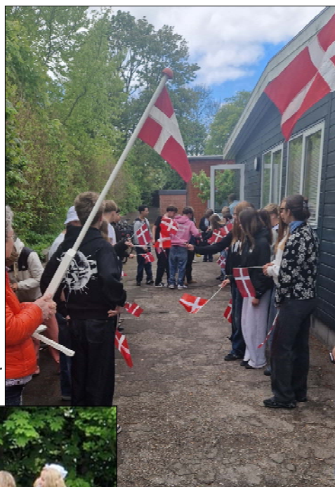
Årets 9. klasse gennem æresporten