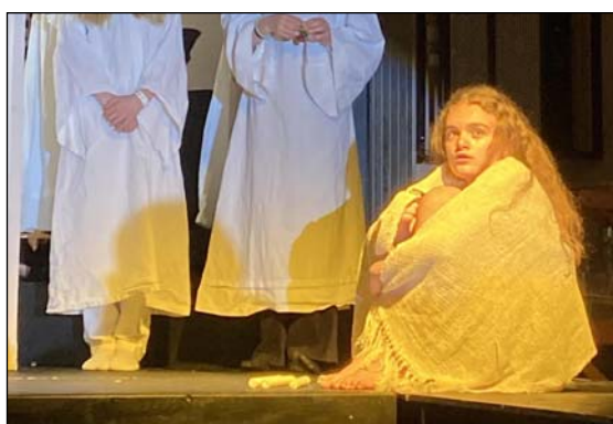
Tekst og fotos: Julie Kronbach-Andersen. Billedtekst: Redaktionen