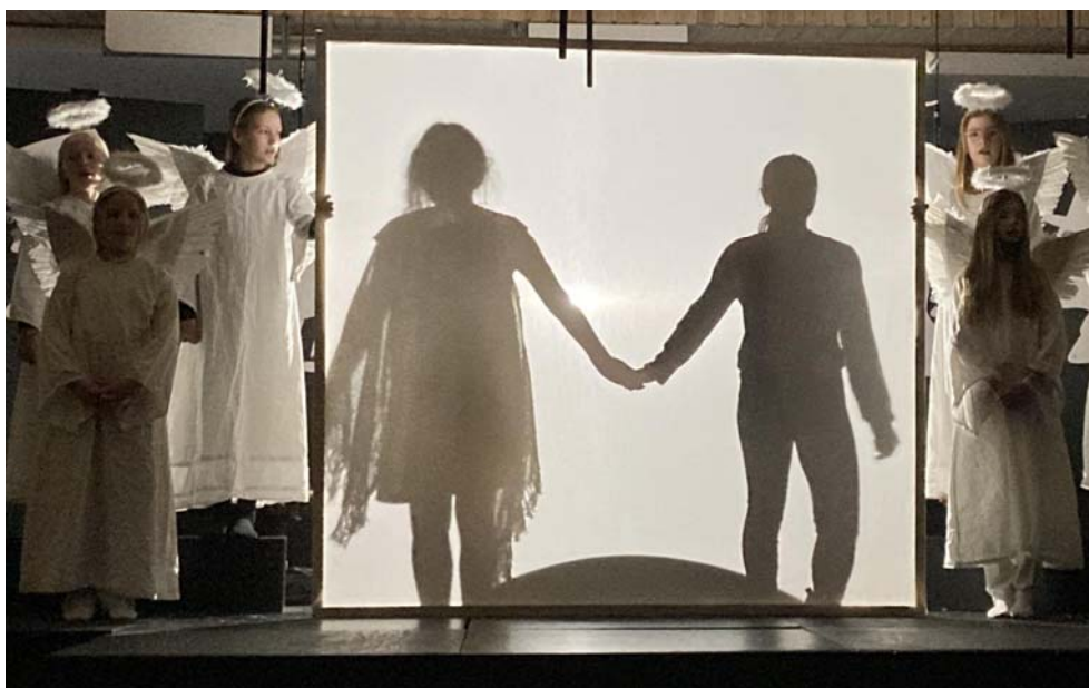
og herunder et par scener fra "Den lille pige med Svovlstikkerne"