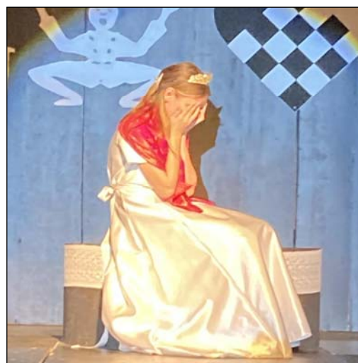
Øverst: Scener fra "Svinedrengen"