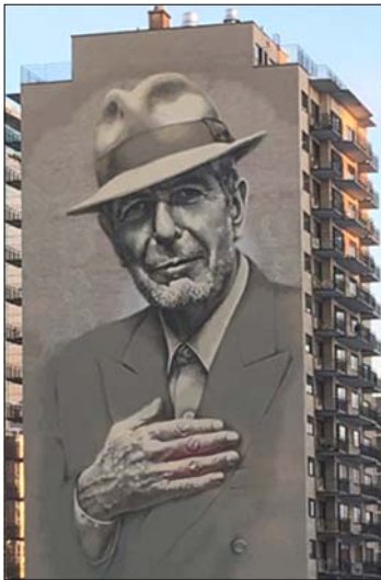
Leonard Cohenportræt på hus - gavl i Montreal.

En musikgudstjeneste, hvor Brothers of Mercy spiller Leonard Cohen-sange, som indgår i samspil med bibeltekster fra Det Gamle og Det Nye Testamente samt prædiken over Leonard Cohens samlede værker