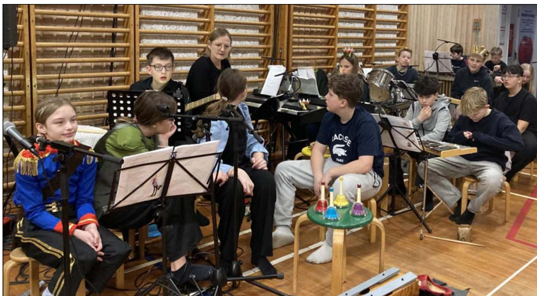
Det fantastiske og talentfulde teaterorkester