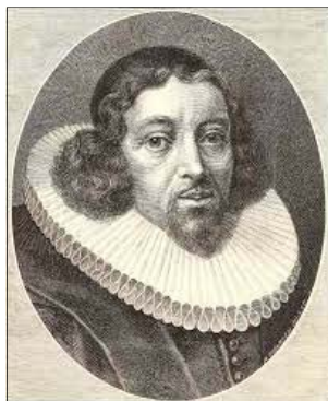
Thomas Kingo

Jeg vil dog ej på verden bygge, om lykken end vil med mig stå, men alt som dagen sig mon rykke, vil jeg min sjæl alt minde på, at glasset rinder, tiden går,