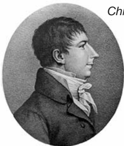
Christoph Ernst Friederich Weyse