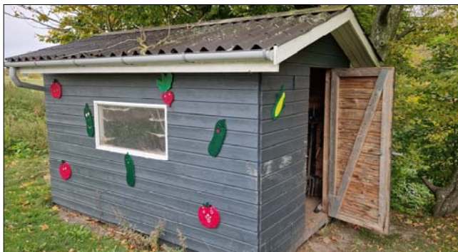
Den nuværende 6.kl. startede allerede før sommerferien et tværfagligt projekt op i de praktiske fag, sløjd og krea, hvor de har fremstillet ny udsmykning til skolegården samt skolehavens redskabsskur. De unge mennesker har bl.a. illustreret skolens værdier og en oversigt over udbuddet af fag.